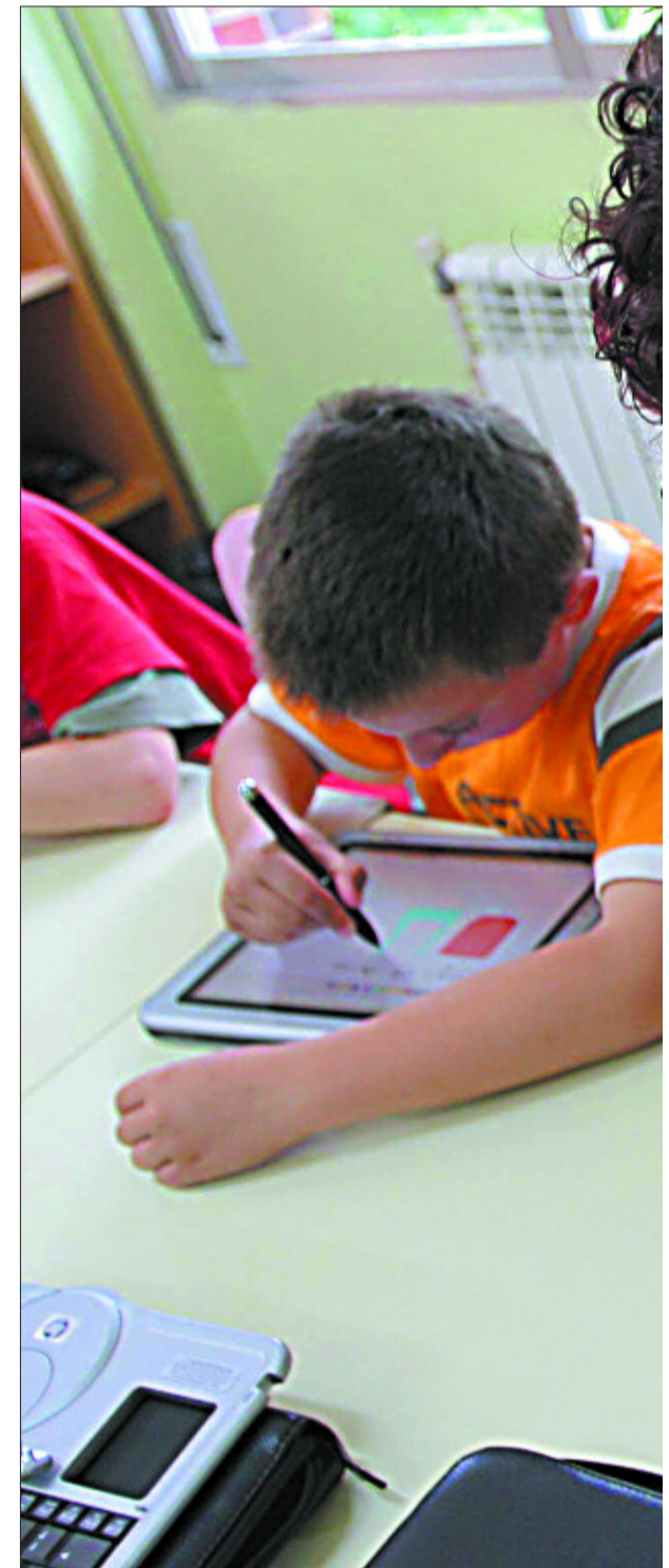
Internet abre la oportunidad de explotar el potencial creativo de los alumnos.

Los especialistas, sin embargo, insisten en advertir de que, evidentemente, un mayor uso